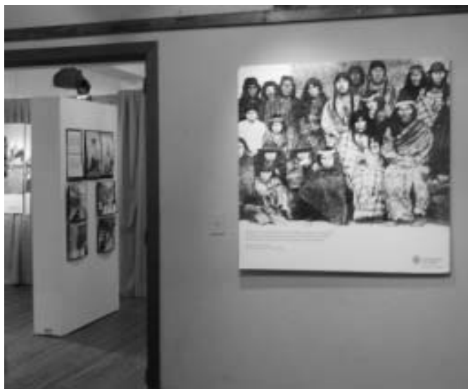
Figura 2: Aspecto general de la muestra en la Sala Chonek del Museo de la Patagonia «Francisco P. Moreno».

rra, la lucha por la recuperación de la identidad mapuche-tehuelche, y el contraste entre su cosmovisión y la cosmovisión occidental vinculada a la noción de territorio y a la armonía con la naturaleza.